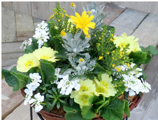
ラタンハンギングバスケット M 2018.1.27